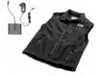
Veste chauffante Ref 5690