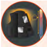
Contrôle de température